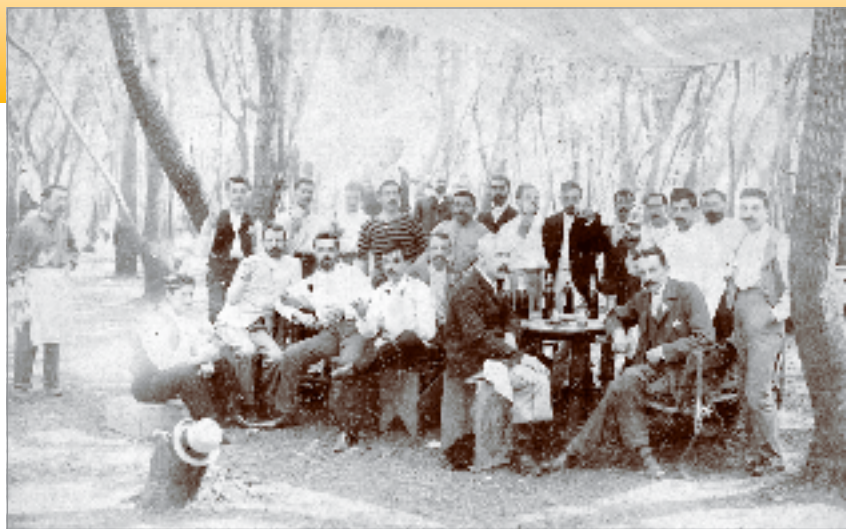
Almuerzo de camaradería en 1898.