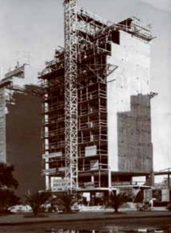
1960, El edificio República en construcción.