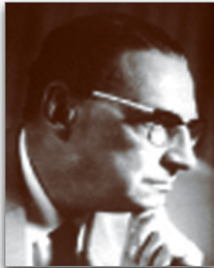
Cr. Alberto Morillo