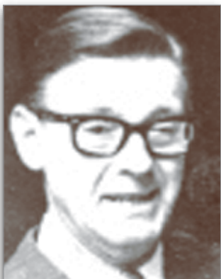
Esc. Nicolás Fernández