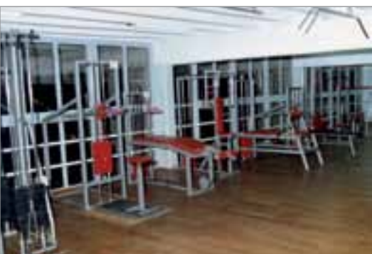
Segunda sala: año 1987.