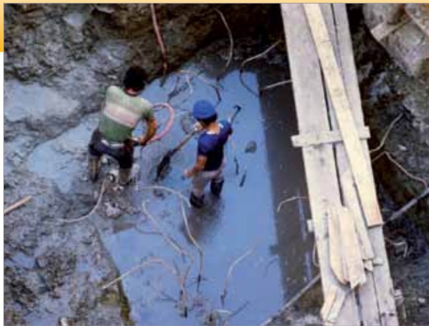
1989, Comienza la construcción de la segunda pileta.