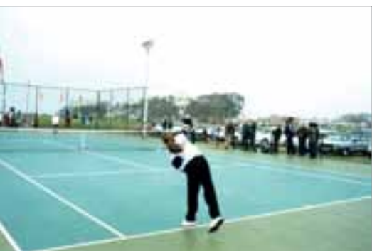
Canchas de tenis y fútbol en el Parque Lavalleja en Carrasco.