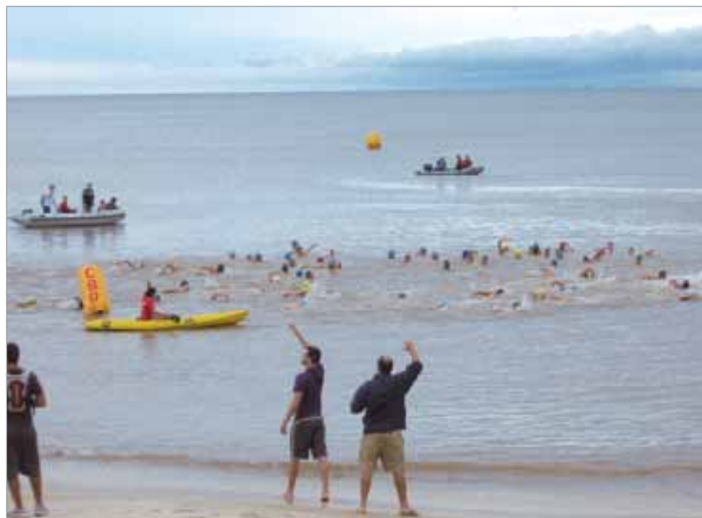
Travesía de la Bahía de Pocitos, edición 2010.