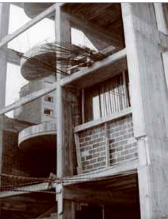
1974, Obras sobre calle Chucarro.