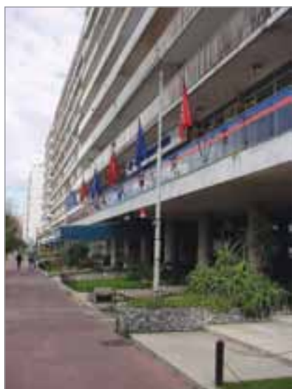
Sede Central en Pocitos.