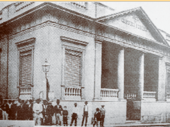
Primera sede en la Ciudad Vieja.