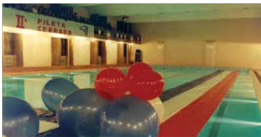
1992, Fiesta inaugural de la segunda pileta cerrada.

Estas instalaciones están orientadas a ello. ●