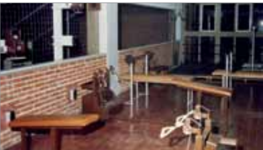
Primera sala: año 1983.

que han tenido tanto los aparatos como los distintos recintos que ocupó esta actividad, con la finalidad de mostrar la evolución del deporte y la preocupación permanente de Club Banco República por mantenerse al día en los avances de las ciencias del deporte y su entorno. ●