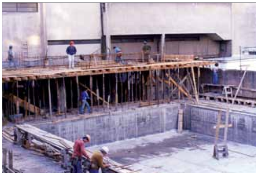
1990, Etapa avanzada de la segunda pileta.

contribuir a construir una comunidad nacional e internacional basada en la salud y en la igualdad de oportunidades desde el punto de vista social.