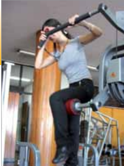
Instalaciones de la nueva sala de musculación con la más moderna tecnología en un entorno renovado.