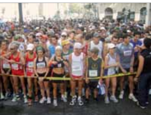
Largada de la Travesía Atlética 2009 desde Banco República Casa Central.

También les recordamos que ya tenemos funcionando un Grupo de Entrenamiento, especialmente coordinado para preparar a los competidores para este tipo de eventos en particular. El mismo funciona los días lunes, miércoles y viernes entre las horas 08.30 y 10.00. ●