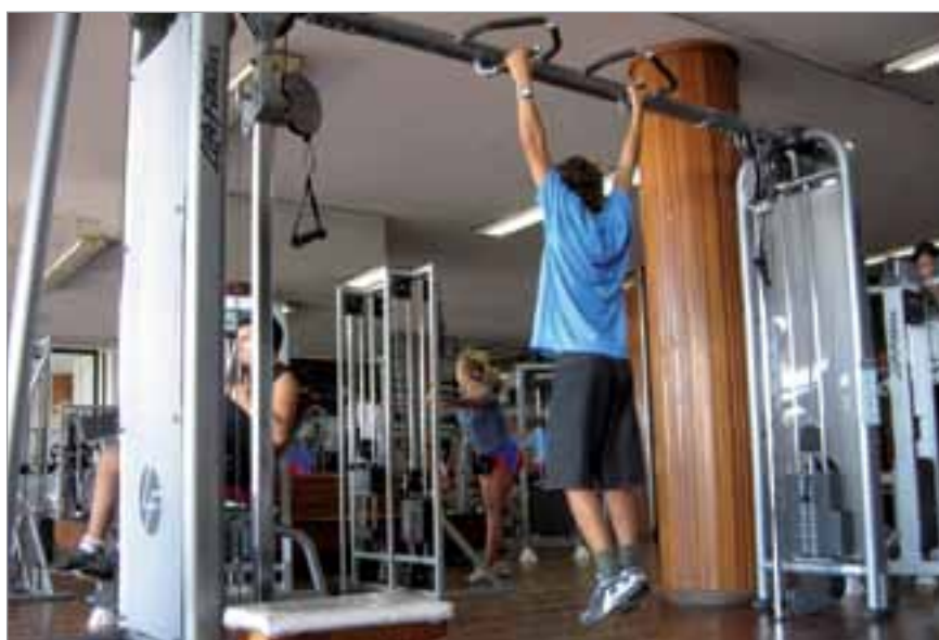
Tercera sala: año 2003.