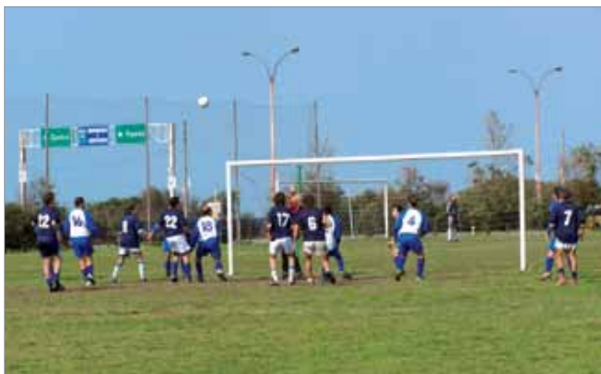
Campeonato interno de Fútbol de Campo para asociados.